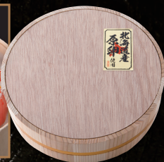
極み明太子 檜樽入り

商品番号 5021 内容量/800g (匠)400g(200g×2)、(ゆず仕込み)400g(200g×2) (特定原材料等/大豆)