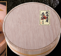
極み明太子 檜樽入り 北海道噴火湾産たらこ使用