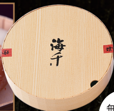
極み明太子 北海道噴火湾産たらこ使用